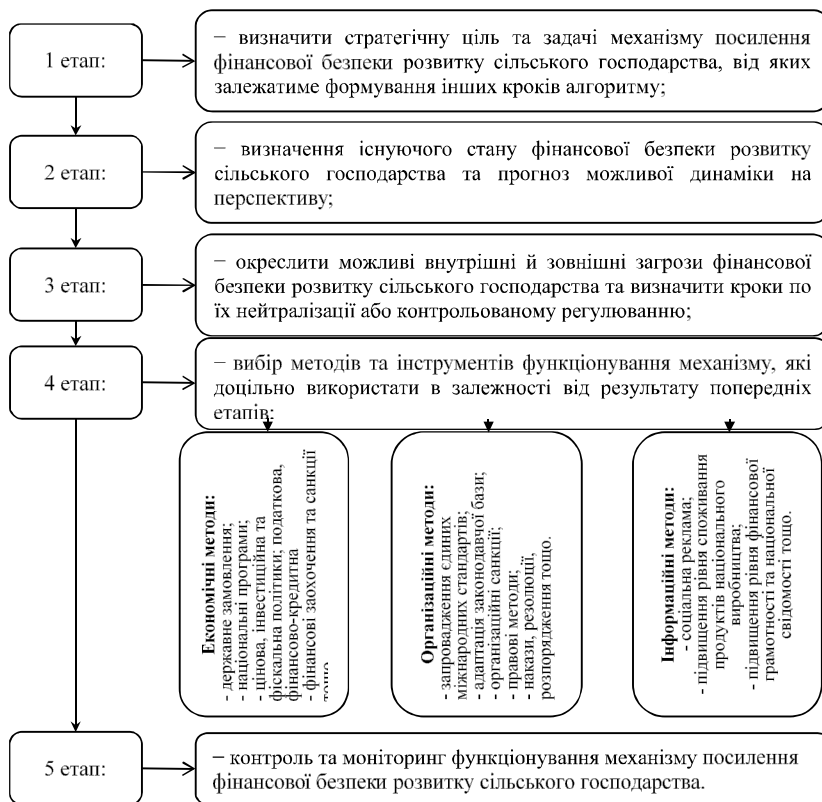
Рис. 2. Алгоритм реалізації механізму посилення фінансової безпеки розвитку сільського господарства

контрольованому регулюванню. Четвертий етап повинен передбачати вибір методів та інструментів управління, які доцільно використати в залежності від результату попередніх етапів. Важливо зауважити, що використання різних методів та інструментів формування фінансової безпеки розвитку сільського господарства повинно здійснюватися комплексно для досягнення найбільшого ефекту. Заключний етап алгоритму має охоплювати елементи контролю та моніторингу за його функціонуванням. Одним з важливих елементів формування фінансової безпеки розвитку сільського господарства виступає фінансовий контролінг, який необхідно здійснювати із використанням таких специфічних методів, як бенчмаркінг, СОФТ-аналіз, АВС-аналіз, нуль-базис бюджетування, аналіз точки беззбитковості тощо. Він повинен бути направлений на координацію витратно-дохідних процесів, врахування ризиків, внутрішній консалтинг та напрями подальшого розвитку підприємства. Для сільського господарства роль фінансового контролінгу дуже важлива, оскільки дозволяє охопити більшість специфічних галузевих характеристик.