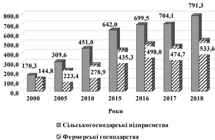
Рис. 3. Виробництво продукції сільського господарства у розрахунку на 100 га сільськогосподарських угідь, тис. грн (у постійних цінах 2010 р.).

Продукція тваринництва також не приваблива для фермерських господарств через високий рівень трудомісткості і збитковість виробництва. У 2018 р. частка фермерства у виробництві молока становила лише 2,0 %, м'яса — 2,5 %, яєць — 0,7 %, вовни — 3,0%, меду — 0,2 %. Вважаємо, що у подальшому продукція тваринництва для фермерських господарств стане важливою умовою збільшення обсягів виробництва, підвищення ефективності використання всіх видів ресурсів, і передусім земельних, створення вищої доданої вартості і прибутковості діяльності.