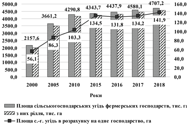
Рис. 1. Площа сільськогосподарських угідь фермерських господарств в Україні

подарства, відповідно до закону, зобов'язані забезпечувати використання земельних ділянок за їх цільовим призначенням; дотримуватися вимог законодавства про охорону довкілля; не порушувати прав власників суміжних земельних ділянок та землекористувачів; не допускати зниження родючості ґрунтів та зберігати інші корисні властивості землі та ряд обов'язків про надання інформації, дотримання санітарних та екологічних вимог, правил добросусідства у землекористуванні; збереження меліоративних споруд [8, с. 363].