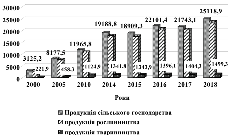
Рис. 2. Динаміка і структура валової продукції фермерських господарств у постійних цінах 2010 року; млн грн

Збільшити показники ефективності використання земельних ресурсів у фермерських господарствах можливо на основі зміни напрямів їх спеціалізації і удосконалення структури виробництва. На сьогодні фермерські господарства виробляють більше 10 млн т зерна, майже 3 млн т соняшнику, їх питома вага у загальному виробництві у 2018 р. становить 14,4 та 19,8 % відповідно. Водночас фермерські господарства виробляють лише 2,7 % овочевої продукції, 5,3 % плодово-ягідної та 0,5 % картоплі. Водночас обсяги виробництва цих культур за період 2000—2018 рр. мають чітку тенденцію до зростання. На нашу думку, саме ці культури є потенціалом зростання ефективності у фермерських господарствах, оскільки можуть забезпечити високу вартість і прибутковість виробленої продукції на основі використання інноваційних технологій, трудових ресурсів села і організаційно-економічних переваг фермерства як форми господарювання.