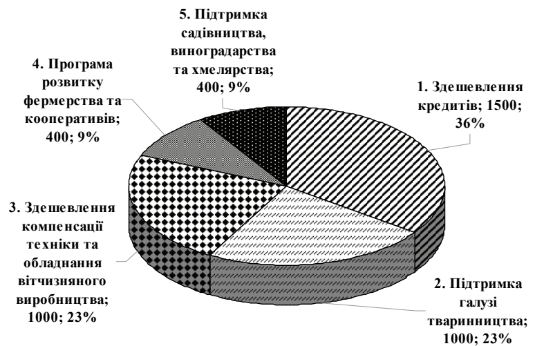
Рис. 5. Напрями державної підтримки АПК у 2020 р. за програмою 1201150 "Фінансова підтримка сільгосптоваровиробників", млн грн

У 2019 р. сільськогосподарськими виробниками було використано 4,34 млрд грн, їх отримали 1667 суб'єктів