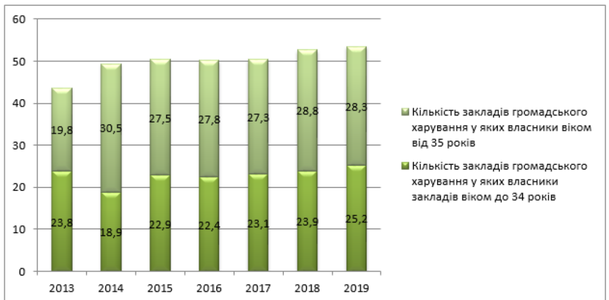
Рис. 2. Динаміка кількості закладів громадського харчування в Україні за 2013 – 2019 рр., тис. шт

У 2019 році за даними Державної служби статистики в Україні налічувалося 53,5 тис. закладів громадського харчування серед них майже половина молодих власників таких закладів. В дану цифру включаються наступні заклади: заклади типу кафе, ресторанів, підприємства мобільного харчування, а також постачання готових страв (рис. 2).