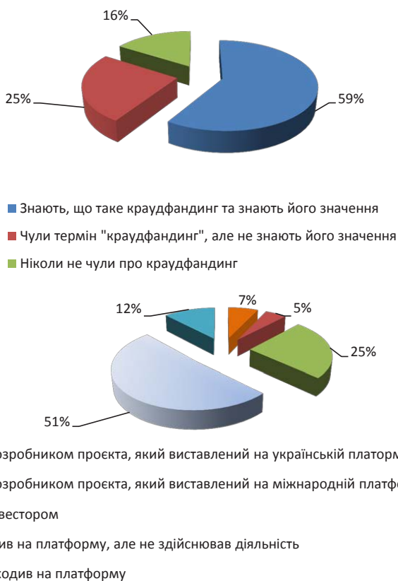
Рис. 2. Результати проведеного соціологічного опитування в соціальній мережі Facebook