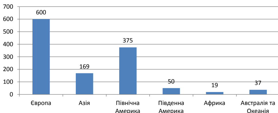
Рис. 4. Кількість краудфінансінгових платформ у світі в 2018 році