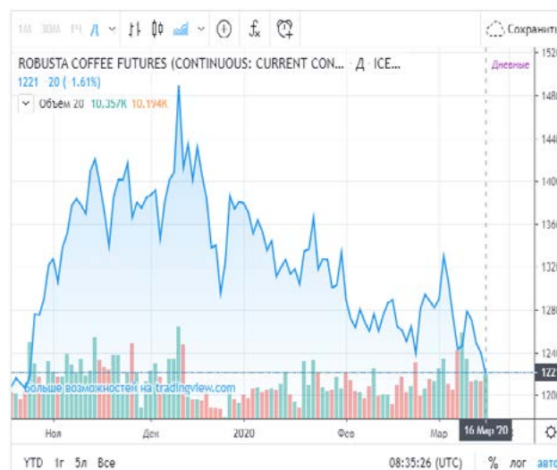
Рис. 2. Ціна на каву на біржі LIFFE

взаємопов'язані, наприклад, посуха в Африці, де вирощується сорт «робуста», приводить до зростання цін на сорт «арабіка».