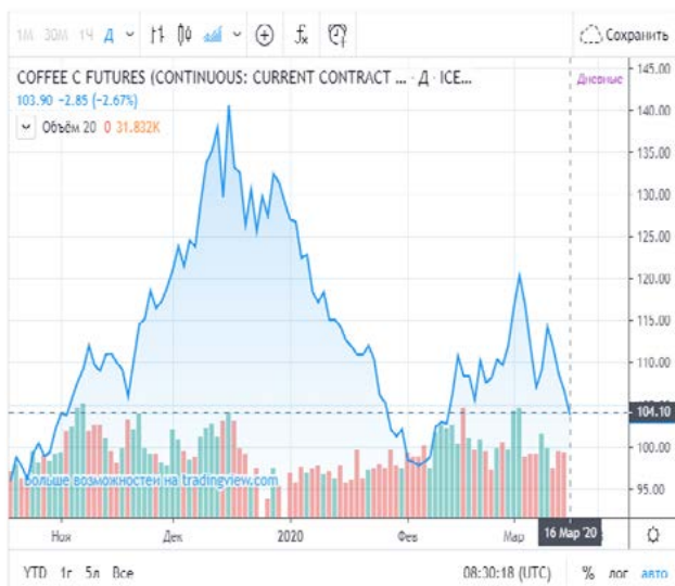
Рис. 1. Ціна на каву на біржі ICE