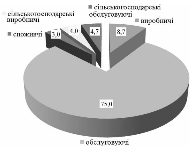
Рис. 2. Структура організаційно-правових форм господарювання станом на 2019 р.

Відповідно до чинного законодавства виробничі сільськогосподарські кооперативи можуть об'єднувати особисті селянські господарства (ОСГ), а вони в аналізованій період, демонстрували тенденцію зменшення в межах 0,8—1,1 % щорічно і не можуть включати фермерські господарства які є юридичними особами.