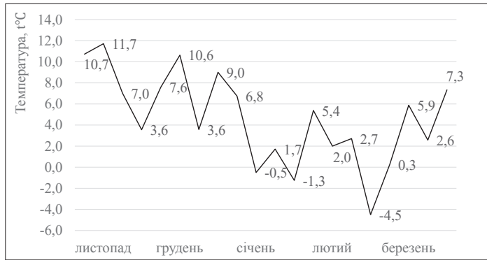
Рис. 1. Температура повітря протягом зимового періоду 2017–2018 років