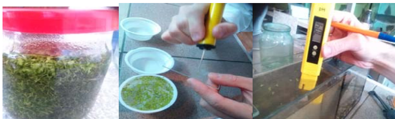
Рис. 1. Фрагмент вивчення якісних та кількісних характеристик фітопланктону для підгодівлі гідробіонтів

Результати проведення попереднього періоду щодо аналізу токсичності показали, що в дослідній групі 1, де зоопланктон для розвитку використовував воду, піддану дії контактної нерівноважної плазми протягом 10 хв, тестована речовина відповідала класу “нетоксична”. Аналогічно для дослідної групи організмів, що виступали тест-об’єктами для плазмохімічно активованої води з концентрацією пероксидних сполук 500 мг/л, цей показник був вищим з відповідністю класу “нетоксичний” (рис. 2).