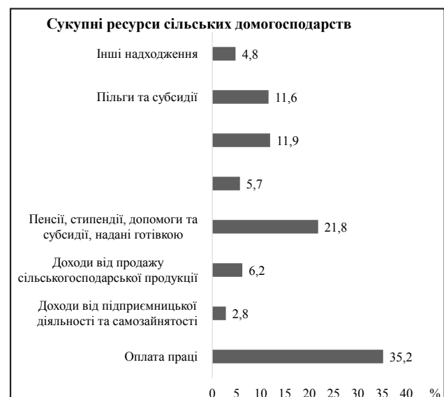
Рис. 1. Структура сукупних ресурсів сільських домогосподарств України у I кварталі 2017 року

Так, доходи домогосподарств від підприємницької діяльності та самозайнятості незначні: у структурі грошових доходів сільських домогосподарств у I кварталі 2017 року вони становили лише 2,8%, що більше ніж в 10 разів менше, ніж припадає на заробітну плату; у 8 разів менше, ніж пенсії; у 3 рази менше, ніж доходи від продажу сільськогосподарської продукції [2].