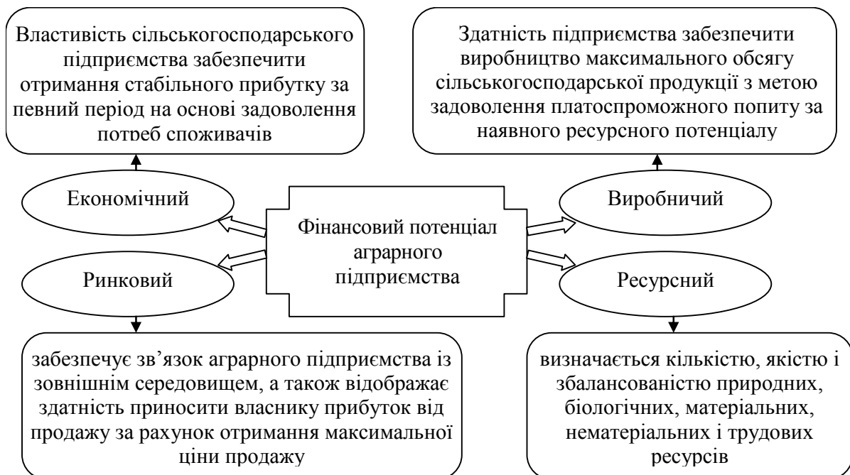
Рис. 2. Фінансовий потенціал аграрного підприємства

На нашу думку, можна виокремити чотири рівні фінансового потенціалу аграрного підприємства: ресурсний, виробничий, ринковий та економічний. На першому рівні знаходиться ресурсний потенціал, який визначається кількістю, якістю і збалансованістю природних, біологічних, матеріальних і трудових ресурсів. Виробничий потенціал відображає виробничий рівень підприємства і базується на ресурсному потенціалі. Його характерними ознаками є застосовувана техніка, технологія, здібності і кваліфікація персоналу. Ринковий потенціал відображає господарський рівень підприємства. Для нього притаманним є дослідження маркетингового середовища, пошук оптимальних каналів збуту виробленої продукції, вивчення ділової активності. Взаємодія ринкового та виробничого потенціалів має два аспекти. Економічний потенціал відображає інституціональний рівень підприємства. На цьому рівні відбувається формування і розподіл прибутку, здійснюється інвестиційна та фінансова діяльність, а також управління постачанням ресурсів, виробництвом та збутом продукції. Розглянутий нами фінансовий потенціал аграрного підприємства наведений на рис. 2.