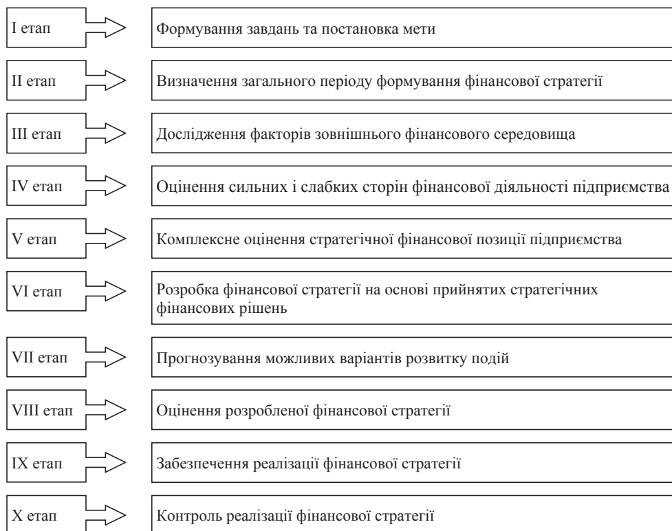
Рис. 2. Етапи формування стратегії фінансового забезпечення