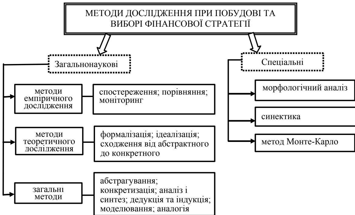
Рис. 1. Пліуралізм методів наукового дослідження для визначення доцільності вибору фінансової стратегії

Серед теоретичних методів дослідження вагома роль, на нашу думку, належить формалізації, оскільки саме вона надає можливість візуально представити фінансову стратегію. Окрім її представлення потрібно детально прописати зміст завдань, визначити терміни виконання, відповідальних осіб, критерії оцінки результату, показники, які дозволяють оцінити рівень наближення до мети, досягнення цільових значень показників стосовно ресурсів та бюджету [1].