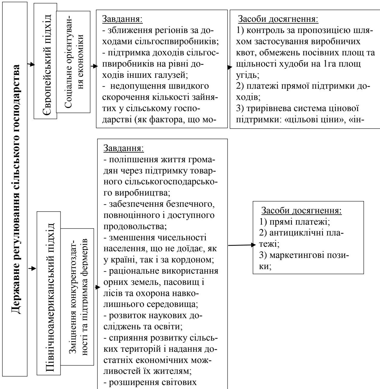
Рис. 1. Світові підходи до державного регулювання сільського господарства

корпорації свою продукцію у тому випадку, якщо ціни встановлюються нижче цін на світовому ринку. Виникненню заставної ціни сприяв високий рівень цін на внутрішньому ринку США, що заважало експорту продукції. При цьому цільова ціна, яка визначала рівень дохідності фермерів, не мала можливості втримати ринкову ціну від падіння.