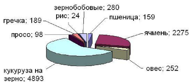
Рисунок 2 – Структура посевных площадей яровых зерновых культур в 2013 г., тыс. га

Ячмень – вторая по размерам посевных площадей и валовому сбору зерна (около 20 %) яровая зерновая культура. В 2013 г. среди яровых зерновых культур наиболее распространенными были кукуруза (59 % площадей посевов, или 4,9 млн га, что на 5,8 % больше, чем в 2012 г.) и ячмень (27 %) (рисунок 2).