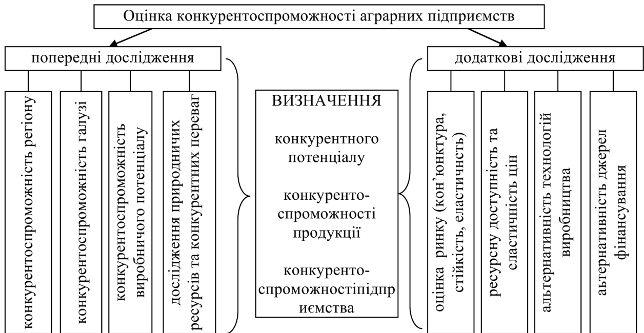
Рис. 2. Стадії та послідовність проведення конкурентоспроможності аграрних підприємств*